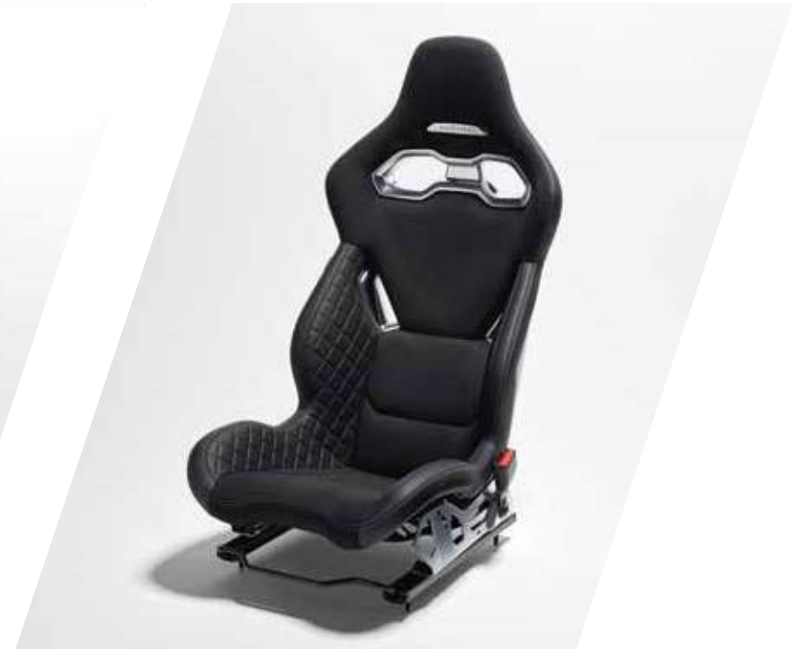
Leichte Sabelt-Rennsitze aus schwarzem Leder und Mikrofaser