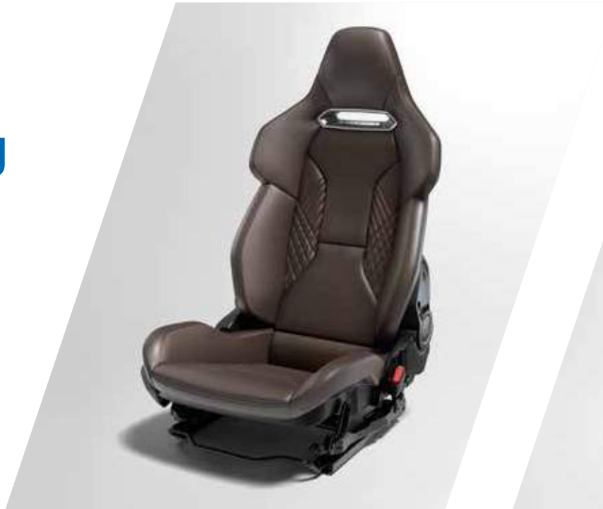
Sechsfach einstellbare Komfortsitze von Sabelt