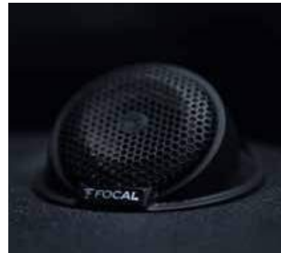
Zwei invertierte Kalottenhoctöner