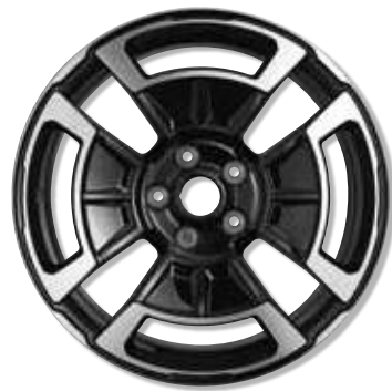
18"-Leichtmetallräder Légende, Diamantschwarz lackiert und glanzgedreht