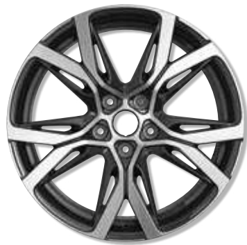
18"-Leichtmetallräder Sérac, glanzgedreht