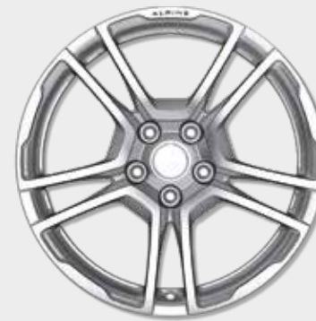
18"-Leichtmetallräder von Fuchs, geschmiedet